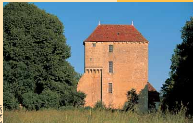
Le donjon du XI e siècle à Ourouer-les-Bourdelins.