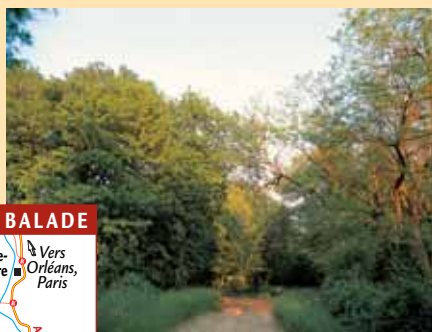
Le bois de Bar, près de Flavigny (accès par la D 6).