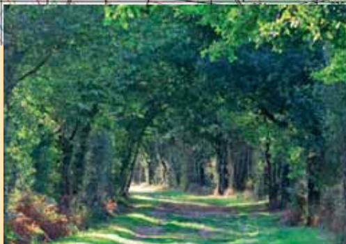
Vue du sentier vers la Vieille Verrerie.