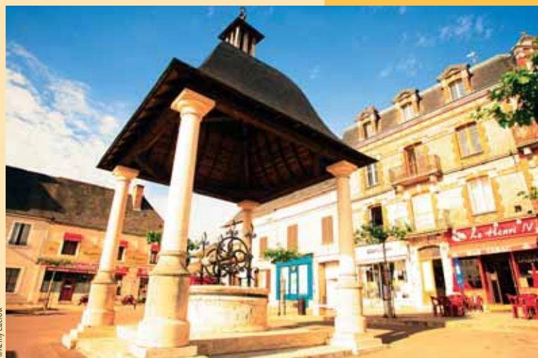
Le puits de la place Henri-IV à Henrichemont.