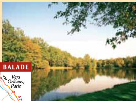
L'étang du Petit Bois, entre les points 5 et 6.